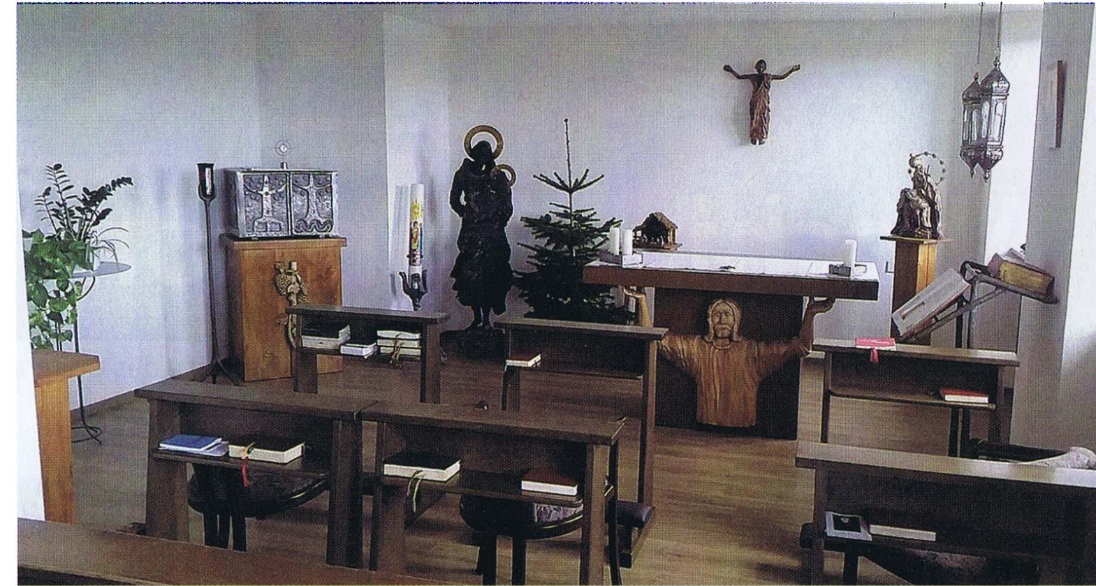
Die Hauskapelle der Oblaten in Oggelsbeuren.